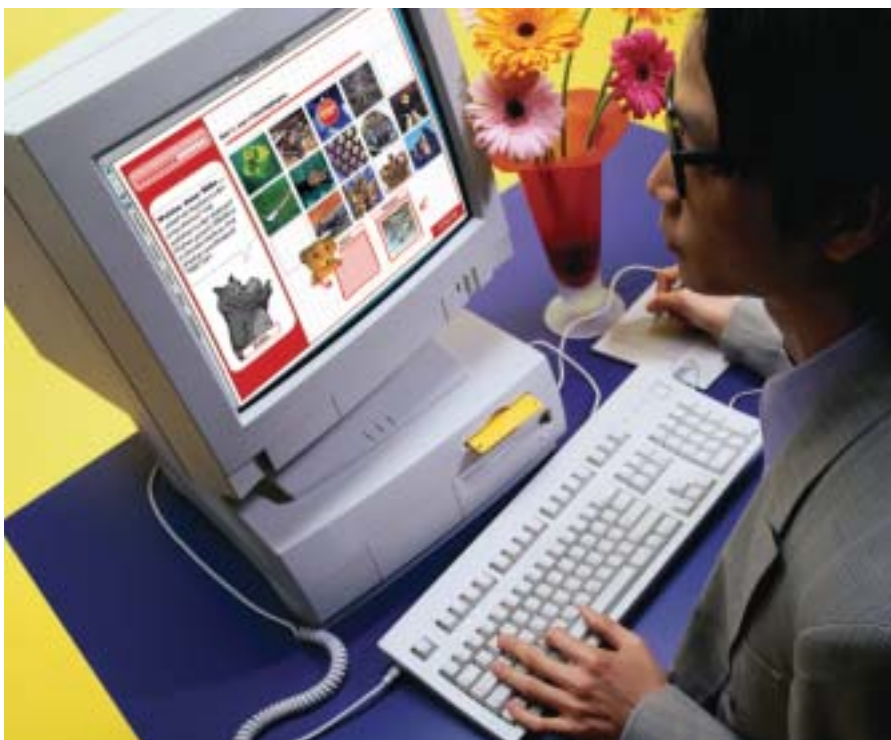
Markenforschung einmal anders: CAPO macht sich den Spieltrieb des Menschen zu Nutze.

APIA ist eine tiefenpsychologische und gruppenspezifische Methode, die mit assoziativen, projektiven, expressiven Techniken arbeitet, um die unterschweligen Phantasien und unbewussten Empfindungen der Verbraucher aufzudecken. In halbtägigen Workshops werden vor allem Bilder und Symbole, weniger Sprache und Begriffe benutzt, um dem ganzheit-